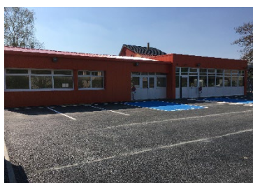
Extérieur salle des fêtes Bédanne