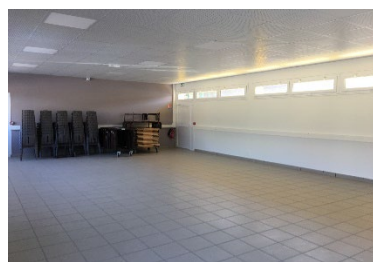
Intérieur salle des fêtes Bédanne