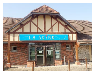
Extérieur salle La Seine