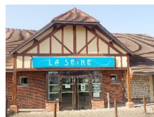
Extérieur salle La Seine