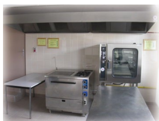
Cuisine salle La Seine