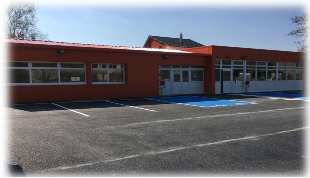
Salle des Fêtes Bédanne