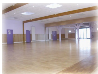
Intérieur salle La Seine