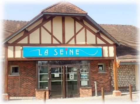
Salle La Seine